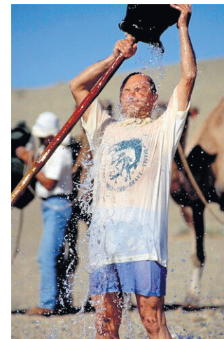
Woda, źródło życia na pustyni