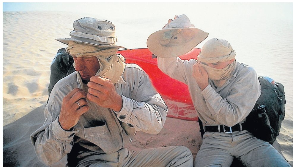
Zabójcza burza piaskowa