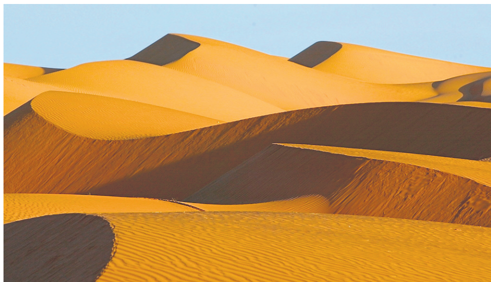
Urokliwe diuny Sahary