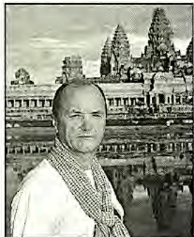
«Я познакомился с Ангкором в 1972-м»

Может быть, очарование этих мест и увеличивает эта ведущая несколько веков борьба растений и камней, в которой нет победителей и побежденных... Или они влекут тем, что здесь, как нигде, видно, насколько мощными и страшными могут быть объятия джунглей... А может, человека привлекает полутьма молчаливых развалин, на месте которых когда-то возвышались прекрасные галереи — теперь они наполовину разрушились, и эти руины и притягивают, и отталкивают одновременно.