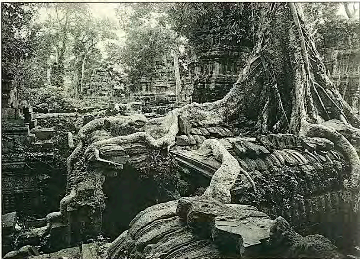
Гигантские корни деревьев атакуют храмовый город

Мне приходит довольно неожиданная мысль. Да, джунгли «поглотили» храмы, но они их и защитили. Так не лучше ли ограничить работы по консервации лишь самым необходимым, чтобы остановить слишком напористое наступление растительности. А в общем-то оставить все как есть, не нарушая волшебного «сценария» молчаливой и драматической борьбы, которая разворачивается здесь между миром камней и могущественной природой.