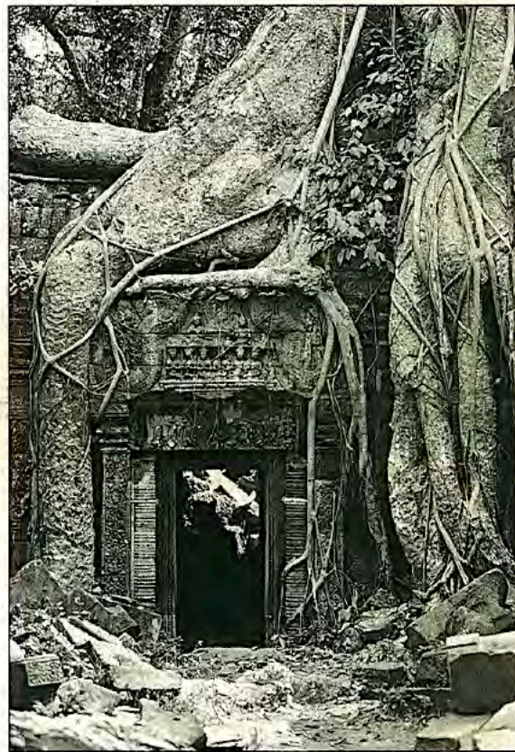
Джунгли «поглотили» храмы и ... защитили их