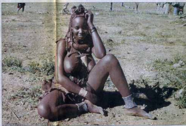
CON LAS TRIBUS DEL AFRICA • En 1989, atravesó solo el África Ecuatorial de costa a costa y realizó un registro etnográfico.