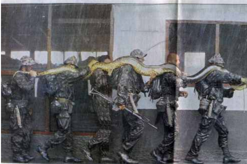
PRÁCTICAS EN LA AMAZONIA • En uno de los recorridos encontraron esta anaconda que medía más de seis metros de largo.