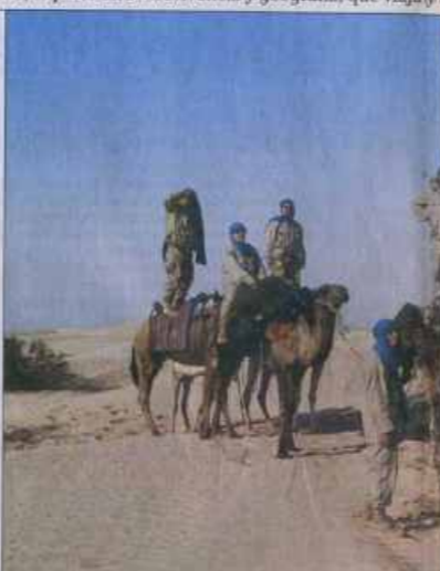
EN EL DESIERTO DEL SAHARA • En las travesías por estos sitios ha de superar los extremos de calor en el día y frío en la noche.