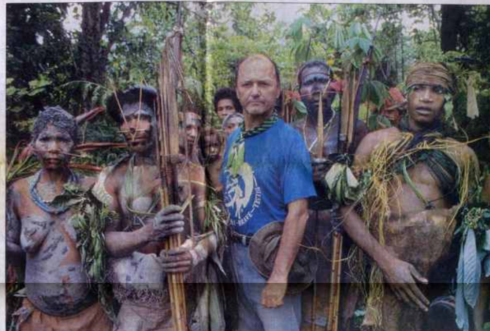
DOS EXPEDICIONES A BRIAN JAYA EN INDONESIA • Palkiewicz considera como uno de los sitios más primitivos de la Tierra a esta provincia de Indonesia y Nueva Guinea. En los lugares más alejados aún se mantienen las tradiciones de canibalismo. La califica como una de las últimas fronteras naturales.