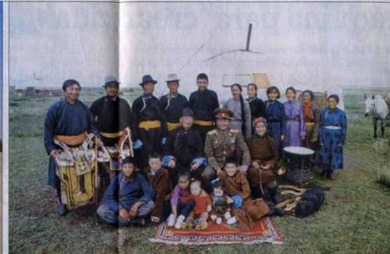
EN LA LLANURA DEL GOBI EN MONGOLIA • Esta familia, del entonces Ministro de Defensa (centro), vive en una tienda de piel.