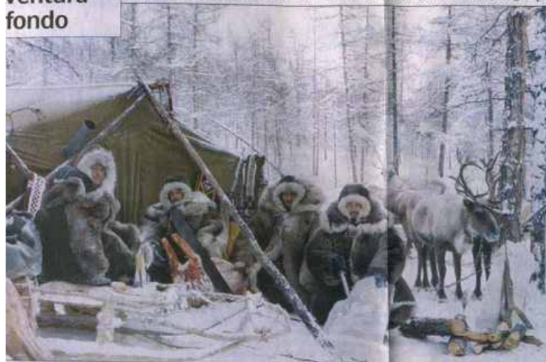
LA CLAVE MÁS GÉLIDA • En este lugar de Siberia la temperatura alcanza el récord de 72 grados centígrados bajo cero.

LOS LUGARES MÁS AGRESTES DE LA TIERRA SON PARTE DE LA VIDA Y LA INSPIRACIÓN DE UN AVENTURERO DEL SIGLO XXI. Desde el sitio más frío hasta el desierto del Sahara son algunos de los destinos que fueron conquistados por un trotamundos que camina con el mismo espíritu que los primeros exploradores. Se trata de Jacek Palkiewicz, un italiano de origen polaco, experto en supervivencia y geografía, que viaja por el mundo en busca de aventuras. Ha escrito 15 libros y publica seis reportajes anuales en el Corriere della Sera, uno de los periódicos más importantes de Europa.